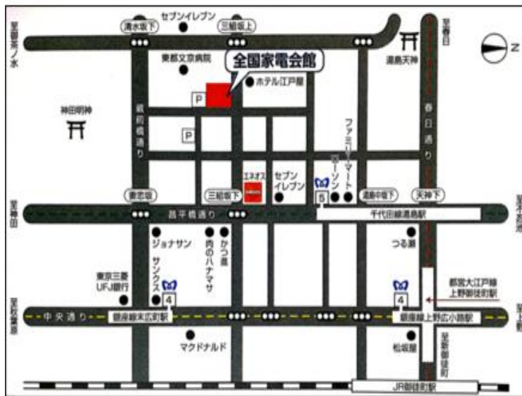
全国家電会館 (文京区湯島3-6-1)